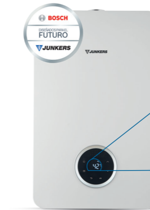
Hydronext 5700 S

Fácil acceso a los componentes de forma que la puesta en marcha, la reparación y el mantenimiento se realizan de la manera más rápida y sencilla posible.